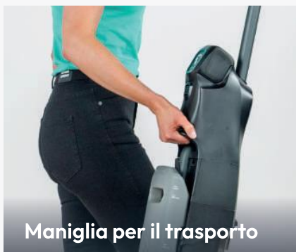
Maniglia per il trasporto