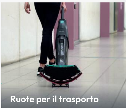
Ruote per il trasporto