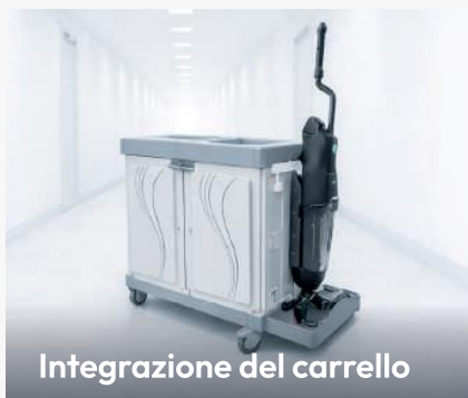
Integrazione del carrello