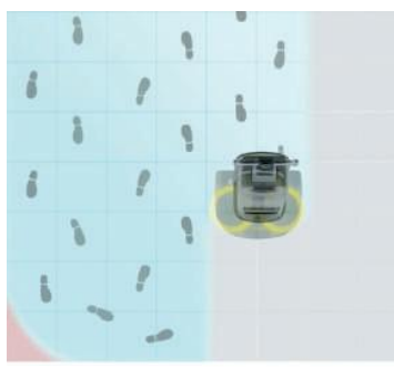
Lavasciuga con manico a T:

Scansiona per guardare il nostro video comparativo.