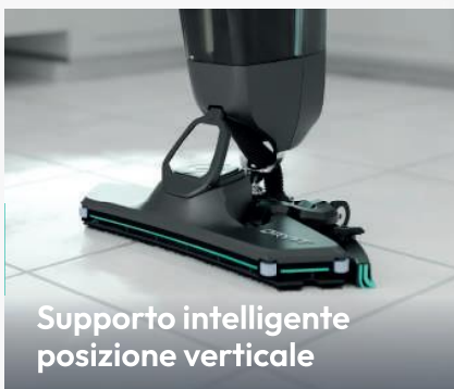
Supporto intelligente posizione verticale