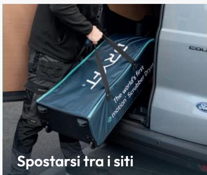
Spostarsi tra i siti