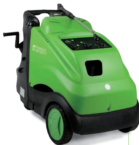
● PW-H80B D1921P T