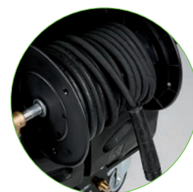
AVVOLGITUBO (optional) Codice KTRI 88654