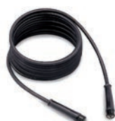
Tubo flessibile A.P. 10 m Codice TBAP 25324