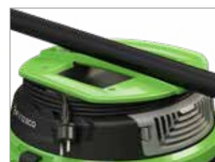
MANIGLIA ERGONOMICA CON AVVOLGICAVO INTEGRATO