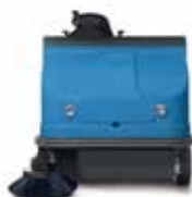
FS90 B-FS90 D 122 cm larghezza lavoro con spazzola laterale