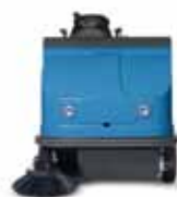
FS80 B-FS80 D-FS80 Bifuel 112 cm larghezza lavoro con spazzola laterale