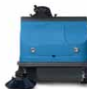
FS110 B-FS110 D-FS110 Bifuel 142 cm larghezza lavoro con spazzola laterale